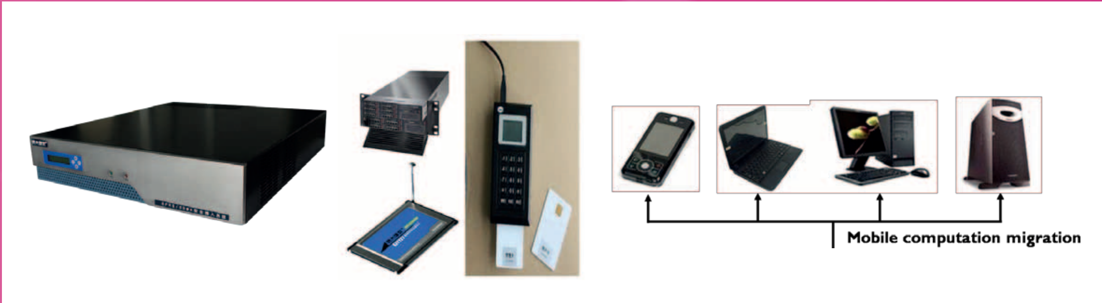
Some Key Equipment in Mobile Electronic Services Supporting Platform

The platform is widely employed by several large enterprises and organizations of different industries in China and is considered as a significant comprehensive platform for the development of China's mobile electric services in the future.