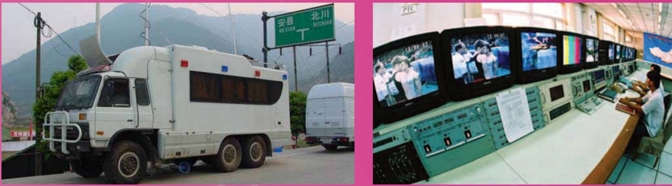
Applications Cases Using the Platform